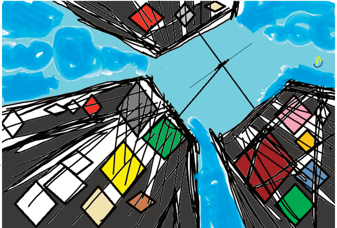
illustrazione di Zaira D'Agata